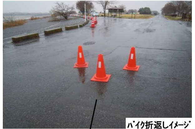
バイク折返しイメージ

Bタイプ 第一ラン(1R) 3km(3km×1周) バイク(B) 50km (10km× 5周) 第二ラン(2R) 10km (2km× 5周)